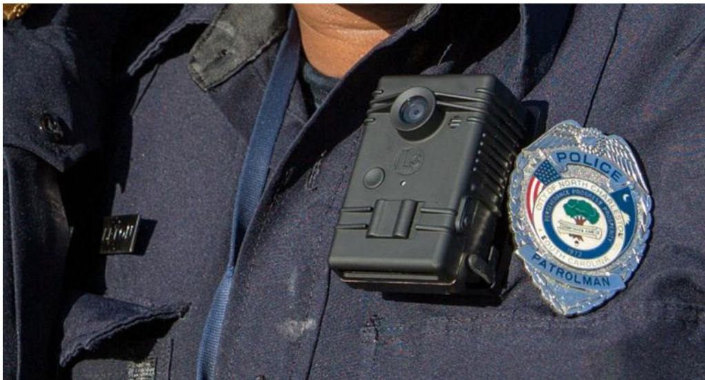
North Charleston police officer with body-worn camera.